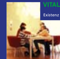
VITALITÄTE IMPULS Existenz & Energie