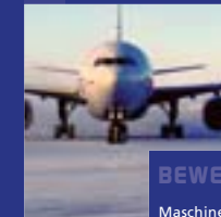
BEWEGUNGS SIGNALE Maschinen & Welten