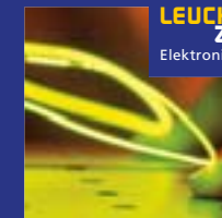
LEUCHT ZEICHEN Elektronik & Optik