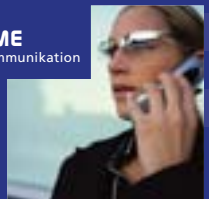
MOBIL TRÄUME Mobilität & Kommunikation